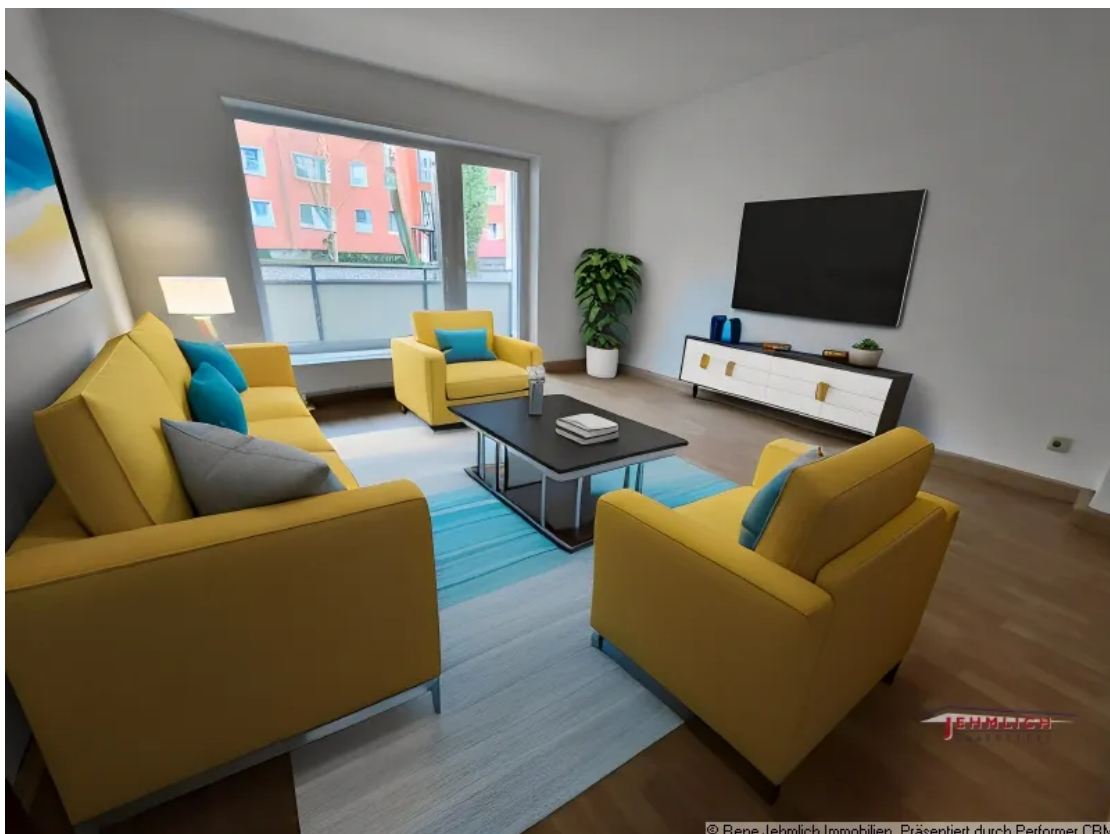
Aussicht vom Balkon am Wohnzimmer

© Rene Jehlich Immobilien. Präsentiert durch Performer CRM