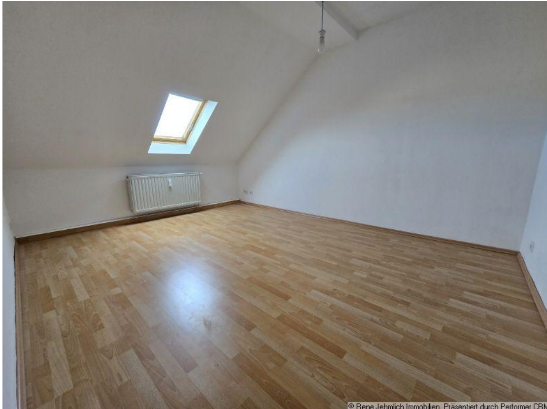
Zimmer im DG