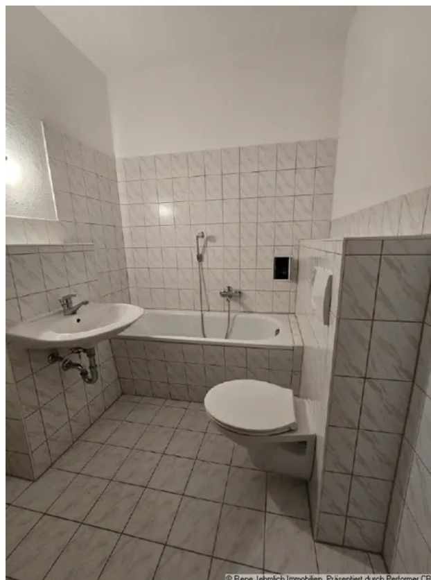
Bad im DG

© Rene Jehmlich Immobilien. Präsentiert durch Performer CRM