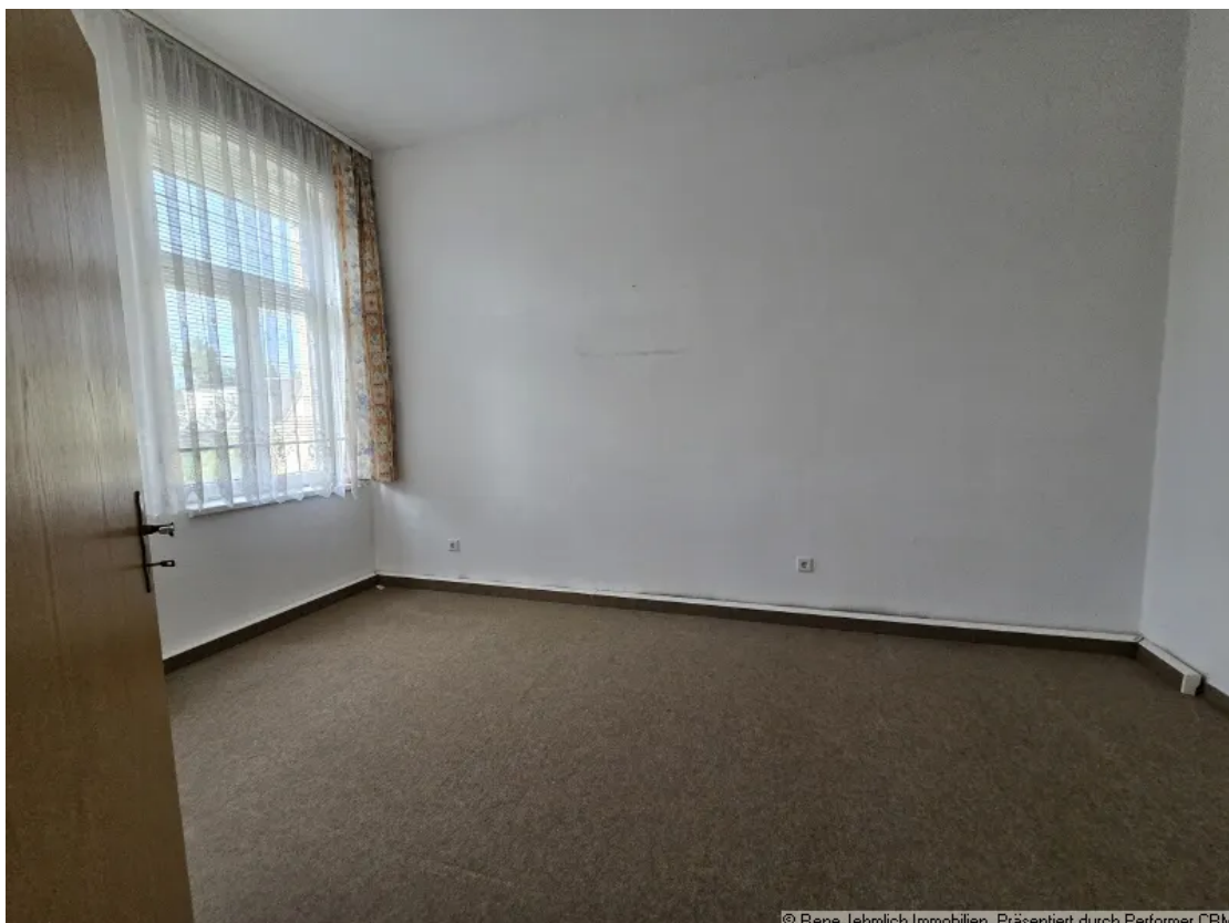
Zimmer auf einer Etage